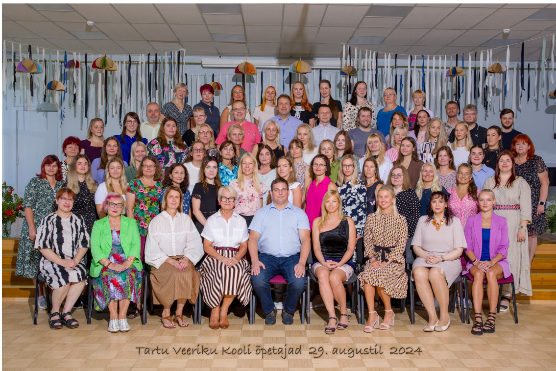
Tartu Veeriku Kooli õpetajad 29. augustil 2024

Minu õpetaja on parim, sest ta on sama hea kui minu parim sõber!